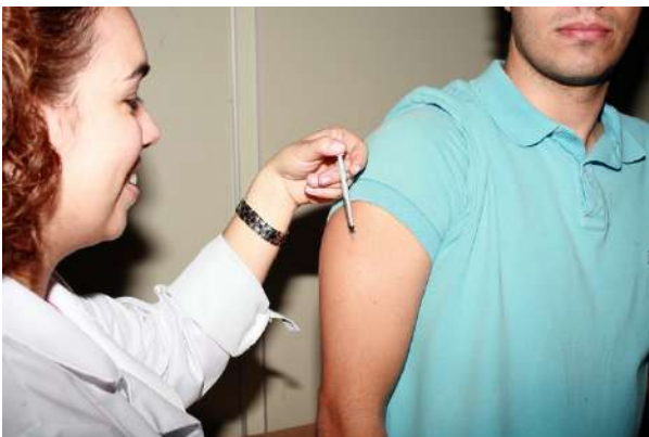
Administração de imunoterapia a paciente com anafilaxia por picada de formiga lava-pé (ALEIT)