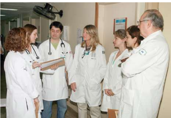
Discussão de caso em andamento no Ambulatório de Alergia (ALE)