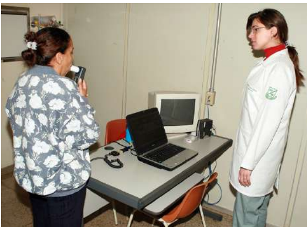
Prova de função pulmonar em realização no Ambulatório de Alergia (ALE)